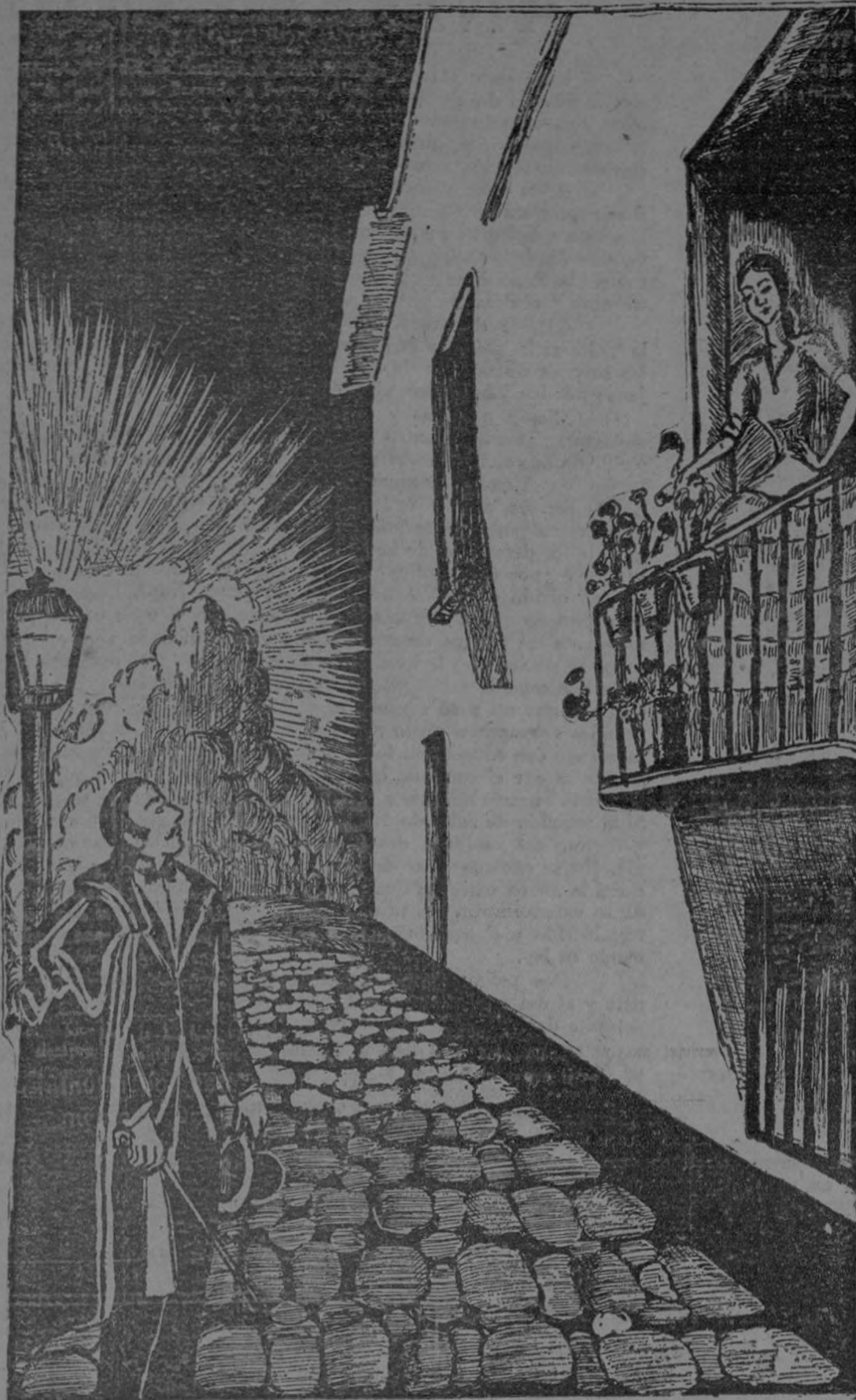
"Por ver quién recogía tu pañuelo que dejaste caer a unos truhanes, con el más bravo de los capitanes al pie de tus balcones tuve un duelo".